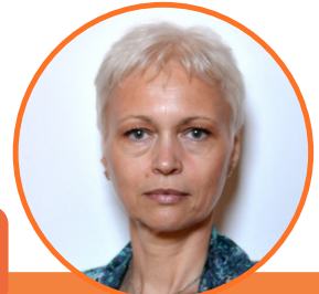
AUTORKA: SVETLANA LAZIĆ