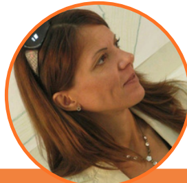
AUTORKA: MARIJA ZOTOVIĆ