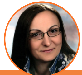
AUTORKA: DRAGICA MIRAŽIĆ NEMET