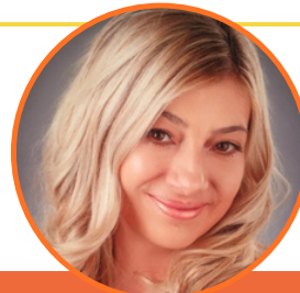
AUTORKA: TATJANA ŽILOVIĆ